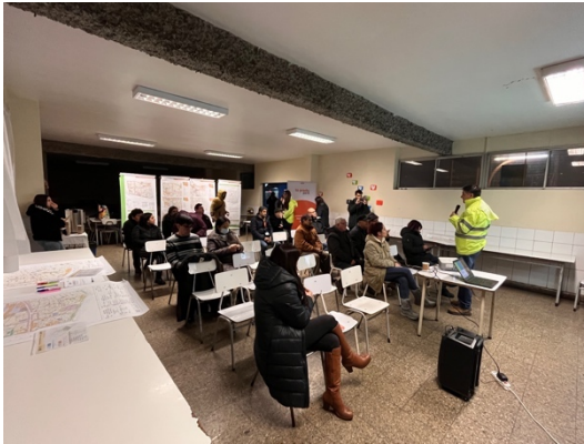
Ilustración 2-10 Registro Jornada con Habitantes Territorio 3 – Taller 2