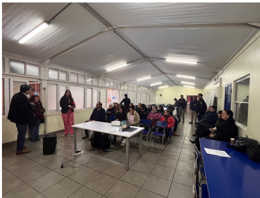
Ilustración 2-7 Registro Jornada con Habitantes Territorio 2 – Taller 1