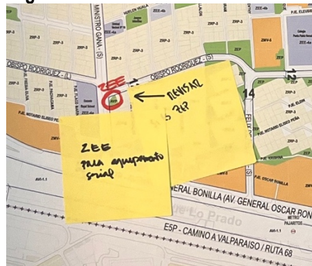
Ilustración 2-2 Registro Observación Taller Profesionales Municipales