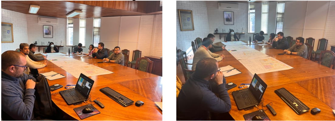
Ilustración 2-1 Registro Taller Profesionales Municipales

En el taller con profesionales municipales se registró una participación de 6 personas , profesionales de Secpla, DOM, Tránsito, DIDECO y DIMAO, según los verificadores que se presentan en los documentos anexos del informe.