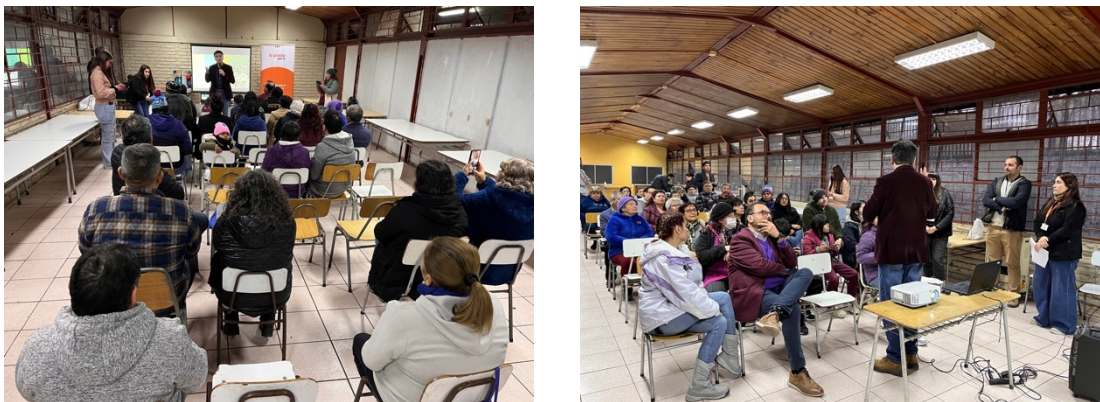
Ilustración 2-4 Registro Jornada con Habitantes Territorio 1 – Taller 1