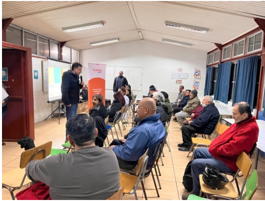
Ilustración 2-9 Registro Jornada con Habitantes Territorio 3 – Taller 1