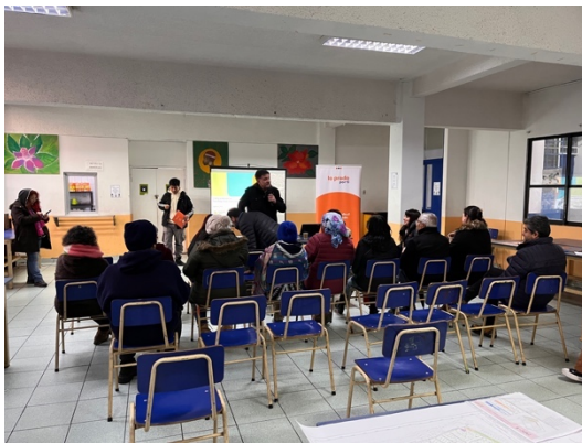
Ilustración 2-11 Registro Jornada con Habitantes Territorio 4 – Taller 1