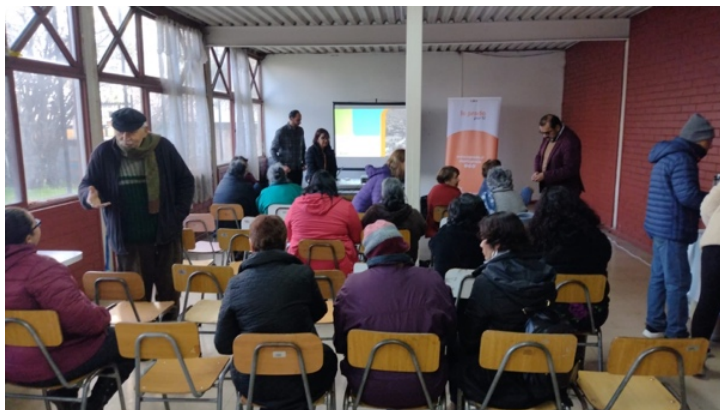
Ilustración 2-12 Registro Jornada con Habitantes Territorio 4 – Taller 2