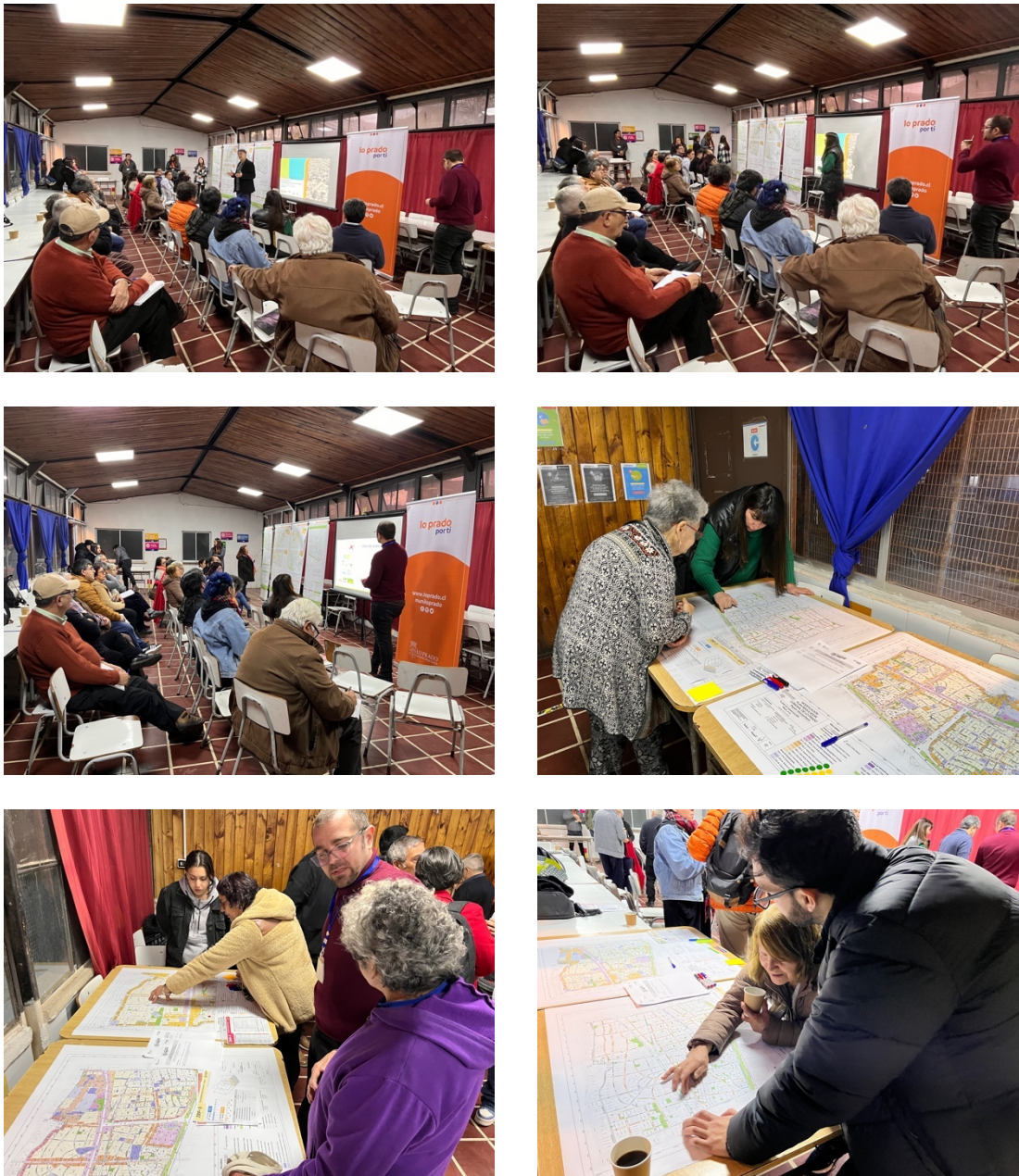
Fuente: Elaboración propia (2023)

En este territorio, sólo se recibieron observaciones a la propuesta de Proyecto Preliminar en el contexto del taller 2, por parte de 6 asistentes, las cuales refieren a lo siguiente: