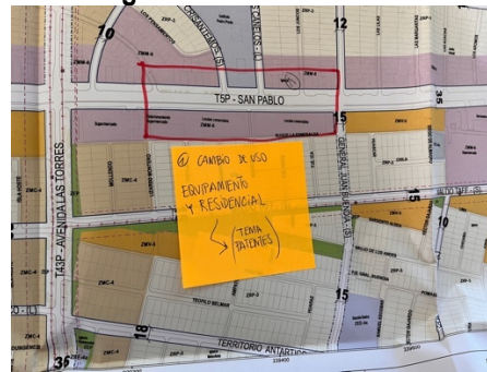
Ilustración 2-6 Registro Observación Territorio 1 Taller 2